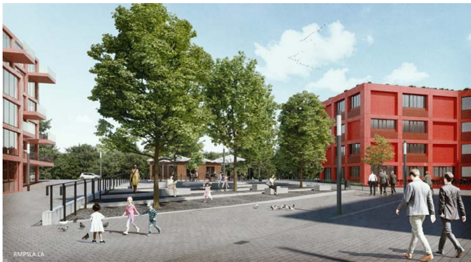
West.side Office Bonn

Bonn, 4. Mai 2020 – Corpus Sireo Real Estate hat Colliers International mit der Vermarktung der Projektentwicklung West.side Office Bonn beauftragt. Der Bürokomplex ist Teil einer Quartiersentwicklung in der Siemensstraße im Stadtteil Enderich. Die Gesamtmietfläche umfasst rund 30.700 Quadratmeter, wovon rund 29.000 Quadratmeter auf Büroflächen entfallen, die restlichen Flächen sind für Gastronomie und Einzelhandel vorgesehen. Die Fertigstellung ist für 2024 geplant.