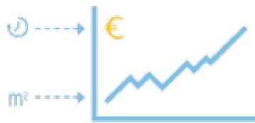
Unabhängige Trend- und Spezialanalysen