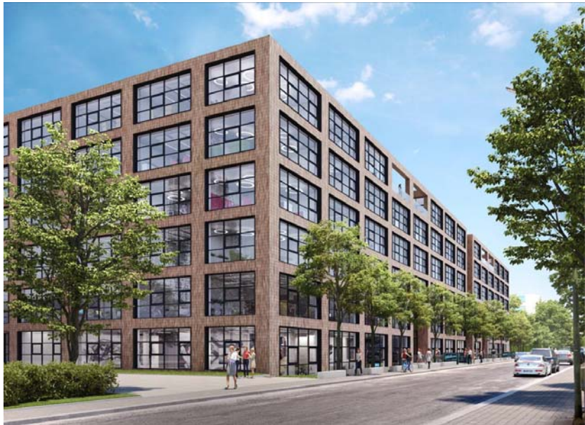
„Neue Siederei“ München.