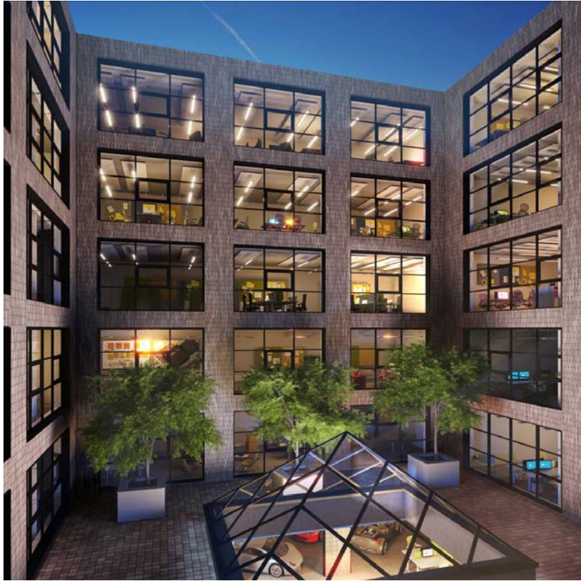
„Neue Siederei“ München.