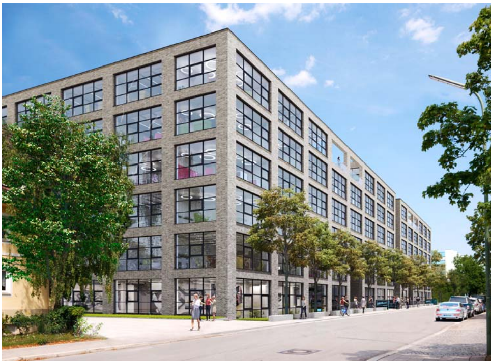
„Neue Siederei“ München.