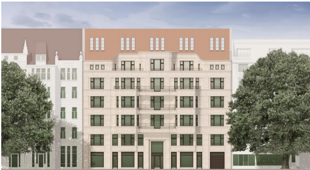
Ansicht „Palais Holler“ Kurfürstendamm

Berlin, 23. Oktober 2014 – Das Immobilienberatungsunternehmen Colliers International Berlin ist mit der Vermietung aller Flächen im Neubau „Palais Holler“, Kurfürstendamm 170, beauftragt worden.